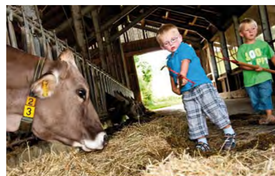
Hautnah „dran sein“ ist besonders für Stadtkinder ein Erlebnis.

Langweilig wird es Kindern mit Sicherheit nicht. Während die Eltern es sich auf der Liegewiese oder Terrasse bequem machen und einfach mal entspannen, gibt es für den Nachwuchs viele Möglichkeiten für eine abwechslungsreiche Freizeitgestaltung rund um das Thema Bauernhof. Auf den kinderfreundlichen Höfen der BauernhoferLEBNISWelt Pfaffenwinkel gibt es viele Tiere zum Streicheln und teilweise auch Pferde zum Reiten und Kutsche fahren. Kinder können beim Melken der Kühe zuschauen oder bei der Stallarbeit helfen. Sie kümmern sich um die Kaninchen oder kleinen Kätzchen, toben im Heu oder übernachten im Heustadl.