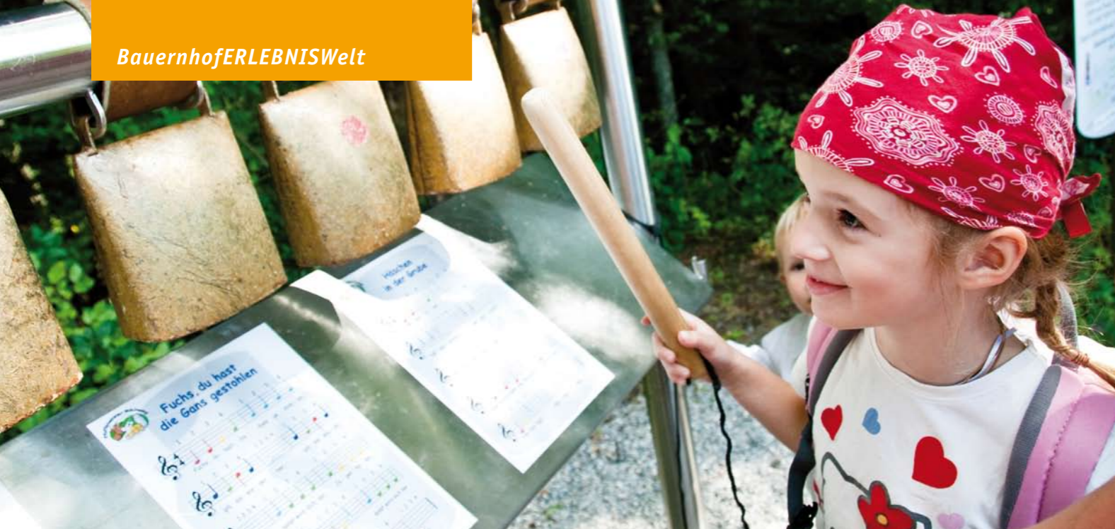
Lern- und Mitmachstationen rund um das Thema Milch bietet der „Pfaffenwinkler Milchweg“.