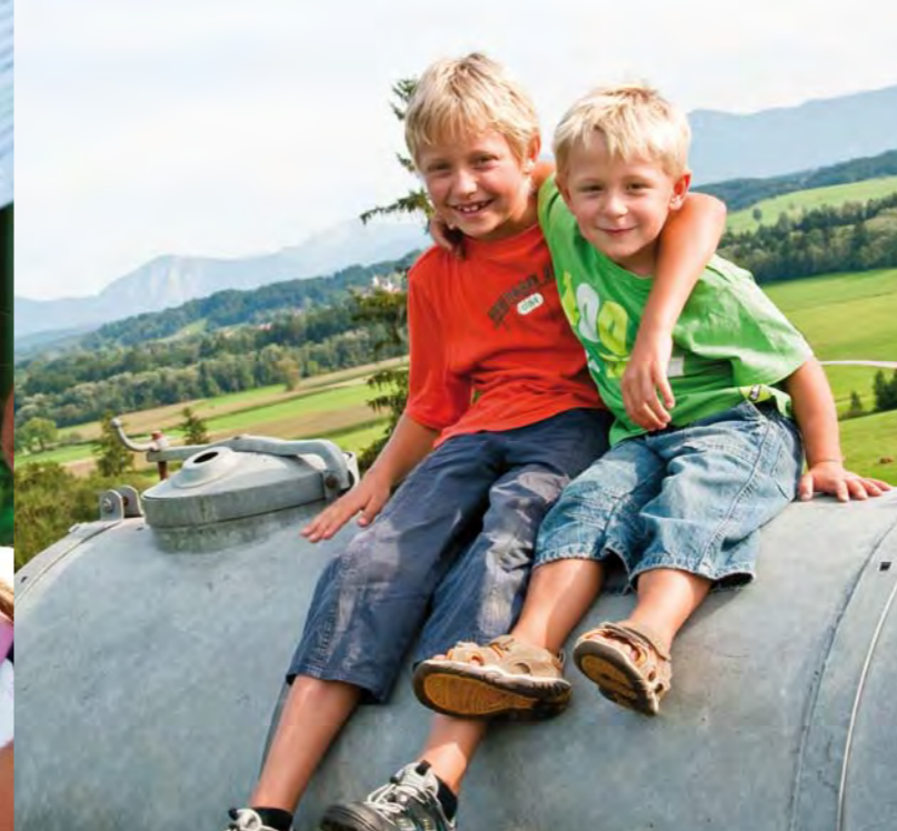
Kinder erfahren spielerisch, wie Landleben heute funktioniert.