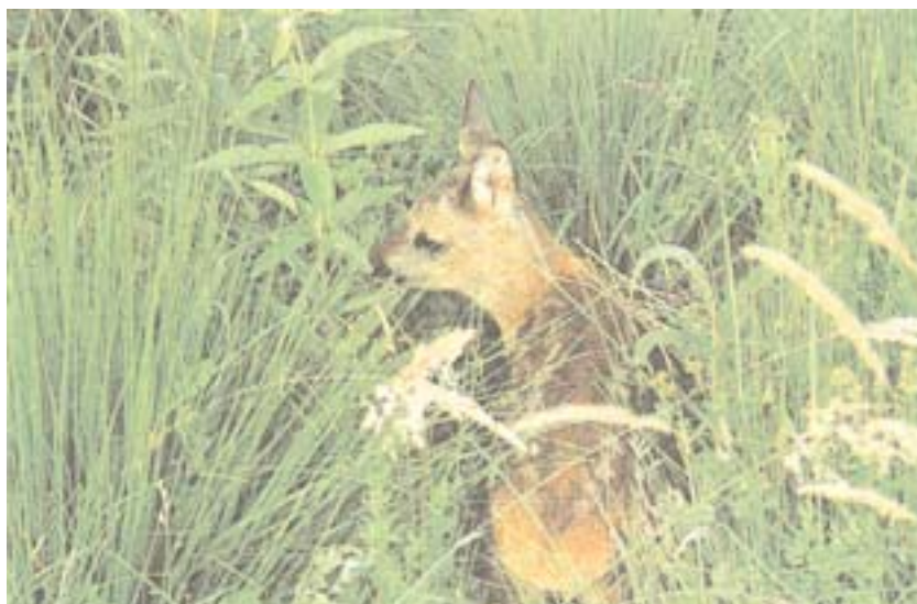
Rehkitz im Hangquellmoor

Sind mehrere Jagdreviere am Verfahren beteiligt, so sollte darauf hingewiesen werden, daß nach der Neuordnung des Grundbesitzes eine Neufestsetzung der Reviergrenzen durch die Jagdgenossenschaften zusammen mit der unteren Jagdbehörde angestrebt wird. In einem abschließenden Termin werden die erarbeiteten Neugestaltungsgrundsätze im Kreis aller beteiligten Behörden und Organisationen nochmals eingehend erörtert. Nach dem Erörterungstermin werden die Neugestaltungsgrundsätze in einem Text- und einem Kartenteil (Planungsübersicht) festgehalten.