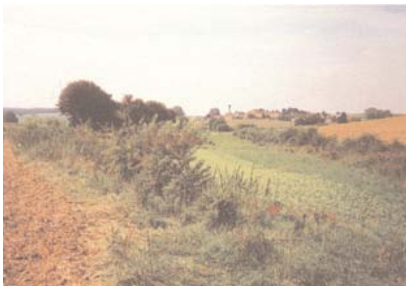
Ranken, Hecken, Wildäsungsflächen — Ruhezone für das Wild