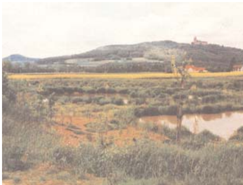
Wasserrückhaltung vermindert Bodenabtrag und schafft neue Lebensräume

Natürliche und naturnahe Gewässer sowie gewässerbegleitende Lebensräume werden in ihrem Bestand erhalten. Eine Umgestaltung kann ausnahmsweise nur aus wasserwirtschaftlichen oder ökologischen Gründen erfolgen. Bei den Bemühungen, den Schutz der oberirdischen Gewässer und die Rückhalte- und Speicherkapazität der Landschaft zu verbessern, besteht die Möglichkeit, die Anzahl und den Umfang vorhandener Wildbiotope zu vergrößern. Über Wege nicht zugängliche und mit ausreichend breiten Uferschutzstreifen bepflanzte Gewässer sind wegen ihrer Ruhelage für das Wild wertvoll, vor allem aber wegen der Bedeutung für den Naturhaushalt und für den Lebensraum Wasser. Viele Möglichkeiten zur Schaffung von Ruhe- und Äsungszonen für alle Niederwildarten bietet die Bepflanzung von Böschungen. Falls eine Bepflanzung mit Bäumen und Sträuchern aus unterhaltungstechnischen Gründen unterbleiben soll, bietet es sich zumindest an, die Böschungen der Gewässer mit ausdauernden heimischen Wildäuspflanzen zu begrünen. Diese flachen Deckungs- und Äuspflanzen können in der Regel ohne großen Pflegeaufwand unterhalten werden.