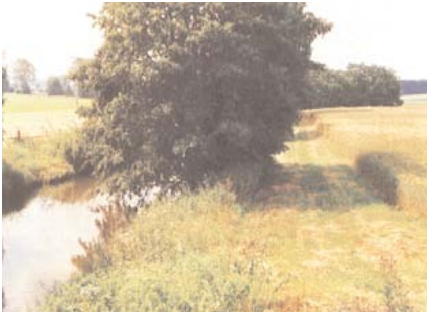
Uferstreifen verbessern die Wasserqualität