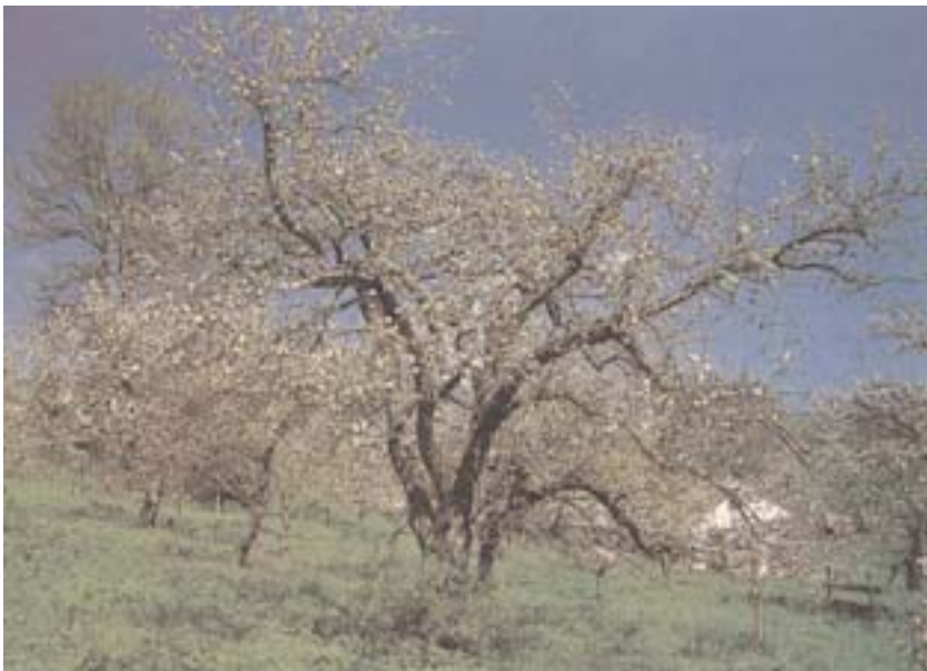
Streuoobstwiese — eine Bereicherung der Landschaft