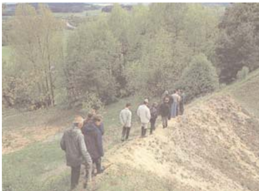
Zusammenarbeit vor Ort