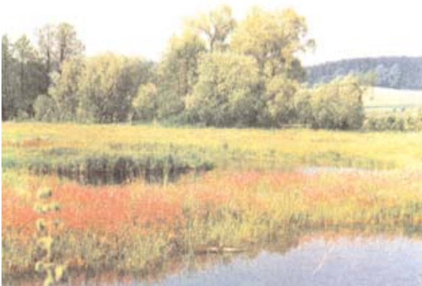
Neuer Lebensraum für bedrohte Pflanzen und Tiere

Die Teilnehmergeinschaft entsteht mit dem förmlichen Beginn der Flurbereinigung und ist eine Körperschaft des öffentlichen Rechts. Sie hat die Anliegen der Teilnehmer, das sind alle Grundeigentümer im Verfahrensgebiet, wahrzunehmen und in diesem Rahmen die Neuordnungsmaßnahmen zu planen und auszuführen. Die Geschäfte der Teilnehmergeinschaft führt ein von der Teilnehmersammlung gewählter Vorstand, dessen beamteter Vorsitzender von der Direktion für Ländliche Entwicklung bestimmt wird.