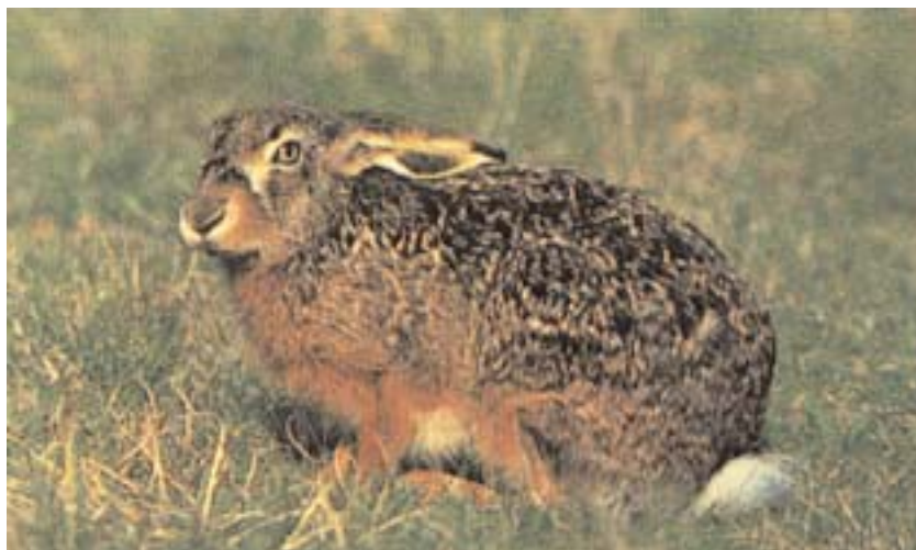
Der Feldhase — Anzeiger einer intakten Landschaft

Beachtung verdient auch der Ausbau von Wegen an der Feld-Waldgrenze. Wenn es die örtliche Planungssituation zuläßt, werden diese Wege nur leicht oder überhaupt nicht befestigt. Nach Möglichkeit sollen ferner ausgebaute Wege unmittelbar entlang von Wasserläufen nicht zuletzt wegen der Störung der hier lebenden Tiere vermieden werden.