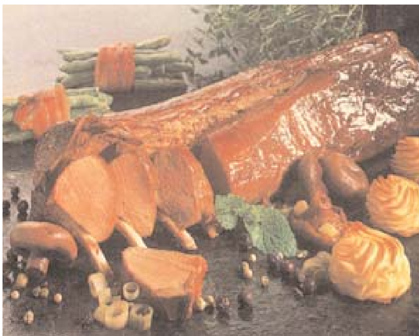
Gesundes Wildbret — eine Gaumenfreude