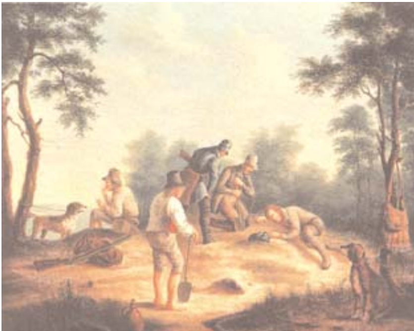
Dachsgraben anno 1800

Das Recht, die Jagd ausüben zu dürfen, war zu allen Zeiten sehr begehrt. Im Mittelalter stand nahezu ausschließlich dem Adel das Recht der Jagdausübung zu. Vom Hochadel (Königen, Fürsten und Bischöfen) wurde die sogenannte »Hohe Jagd«, im wesentlichen die Jagd auf Rot- und Schwarzwild, ausgeübt. Vom übrigen Adel wurde die »Niedere Jagd« auf Rehwild, Hasen, Rebhühner und dergleichen betrieben.