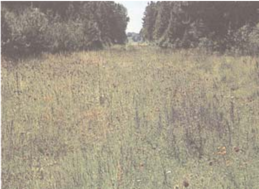
Ungedüngter Wildacker im Wald

Die Teilnehmergeinschaft berücksichtigt bei der Planaufstellung die Umweltverträglichkeit der Planungen. Sie stellt die umweltrelevanten Informationen in einer Umweltverträglichkeitsstudie zusammen.