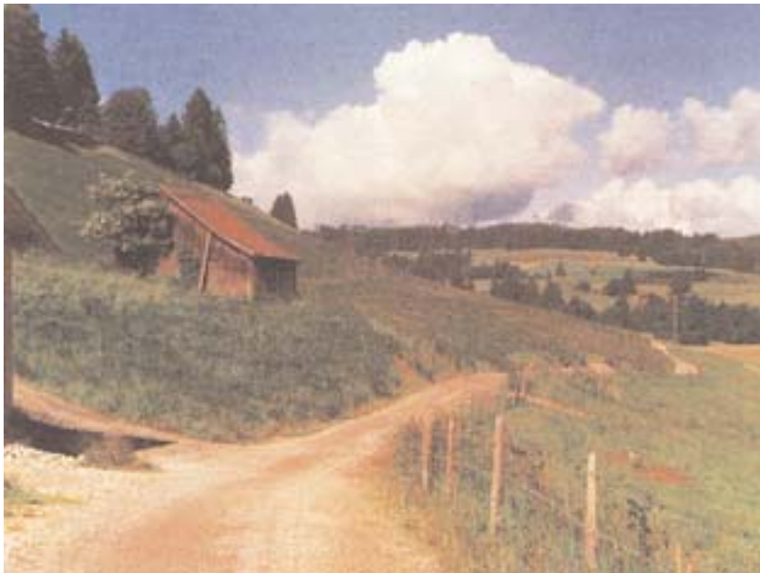
Der Landschaft angepaßter Kiesweg