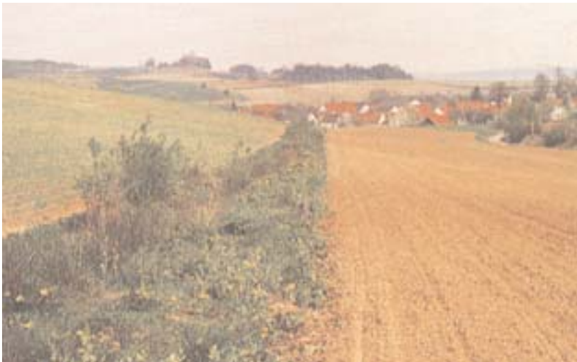
Grünstreifen zwischen zwei Ackerlagen schaffen Äsung und Deckung für das Wild