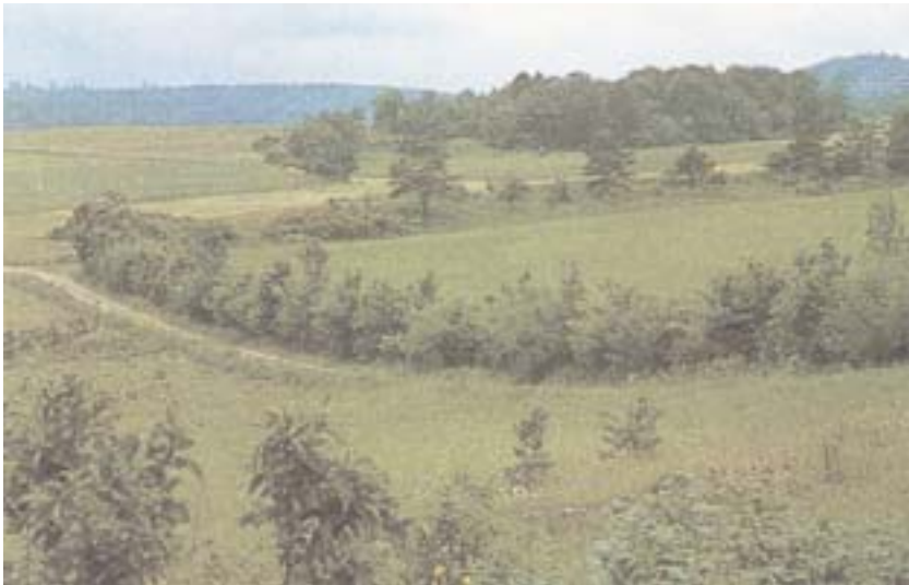
Raine, Hecken, Feldgehölze — Lebensadern in der Flur

Wertvolle Feuchtflächen und Trockenrasen, Naturdenkmäler und Landschaftsbestandteile bleiben so erhalten und werden auf Dauer gesichert. Unvermeidbare Eingriffe werden durch geeignete Maßnahmen ausgeglichen.