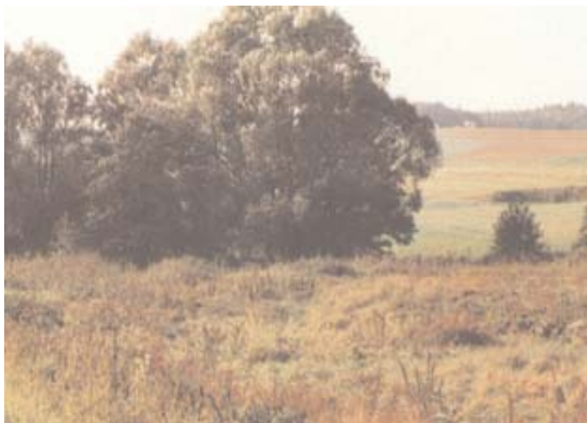
Alltgrasflächen sind die Kinderstuben für das Wild

Ebenso wichtig wie Hegeflächen sind Wildeinstandsflächen in unserer von vielen Straßen durchschnittenen Landschaft. Sie bilden in der Flur, verbunden mit Feldgehölzen und Ödländereien, die idealen Rückzugsgebiete für unser Niederwild.