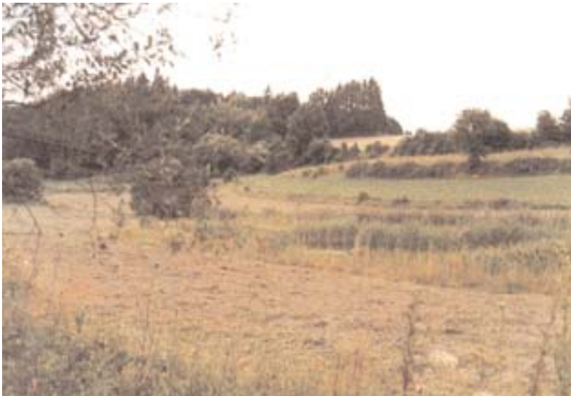
Neue Feuchtfäche im Wiesental